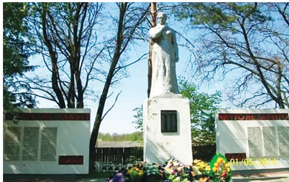
Братские могилы на сельских кладбищах Льговского района

Многие задаются вопросом, почему в России одна из самых низких пенсий в мире? Конечно, есть много стран, где она полностью отсутствует. Однако факт остается фактом. Стоит разобраться в этом вопросе подробнее.