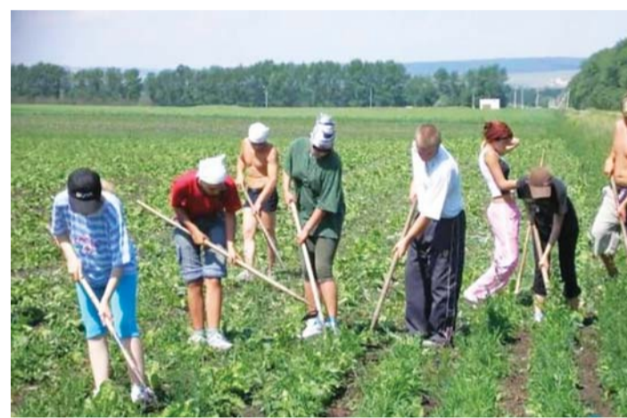
«Развитой» капитализм в России

Правда, вице-премьер Татьяна Голикова в интервью Владимиру Познеру говорила, что бедных «убавят» к 2024 году. Но, видимо, задачи «усложнились». В прошлом