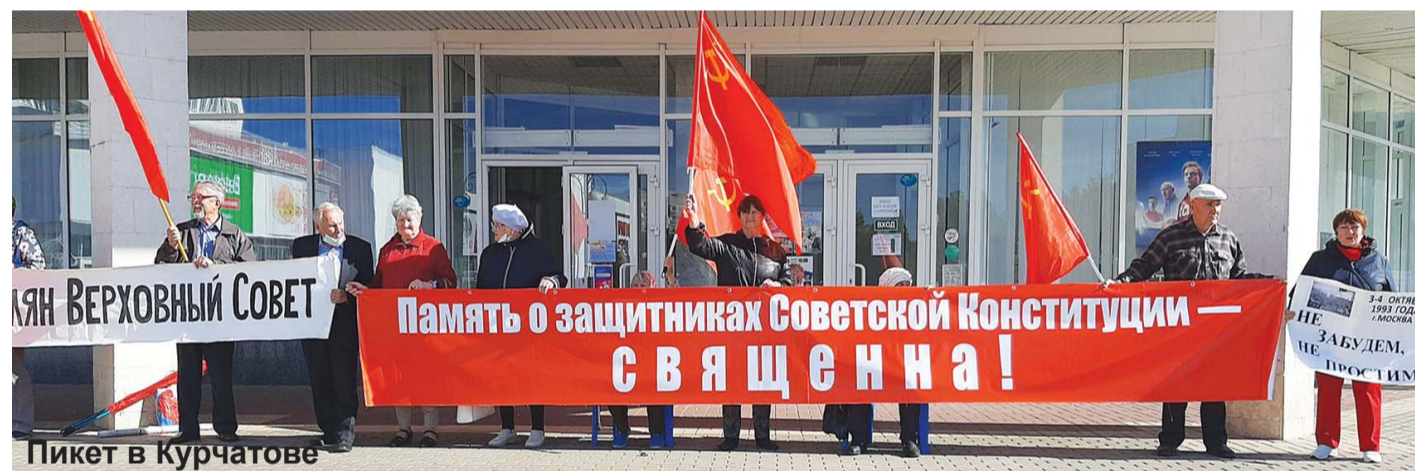
Пикет в Курчатове

3-4 октября 1993-го... По прошествии более четверти века в очередной раз вспоминаем ту черную расстрельную осень, танковый обстрел Верховного Совета, поименно поминаных павших. Но и тех, кто выполнил преступный приказ, нужно назвать поименно.