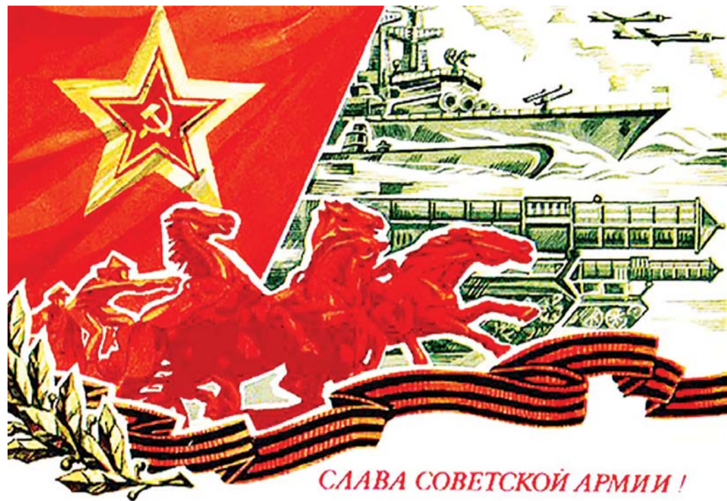
СЛАВА СОВЕТСКОЙ АРМИИ!

Н.Н. ИВАНОВ, 1-й секретарь Курского ОК КПРФ, депутат Государственной Думы ФС РФ, председатель ЦКРК КПРФ, полковник запаса