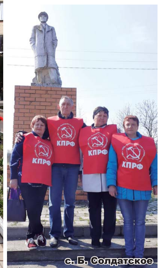
с. Б. Солдатское