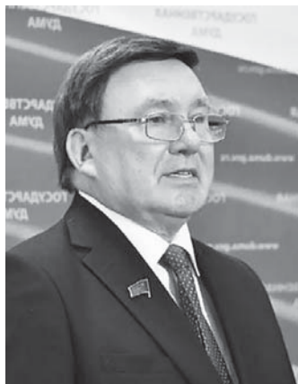
Н.Н. ИВАНОВ - 1-й секретарь Курского ОК КПРФ, депутат Государственной Думы ФС РФ - вновь избран председателем Центральной контрольно-ревизионной комиссии КПРФ.