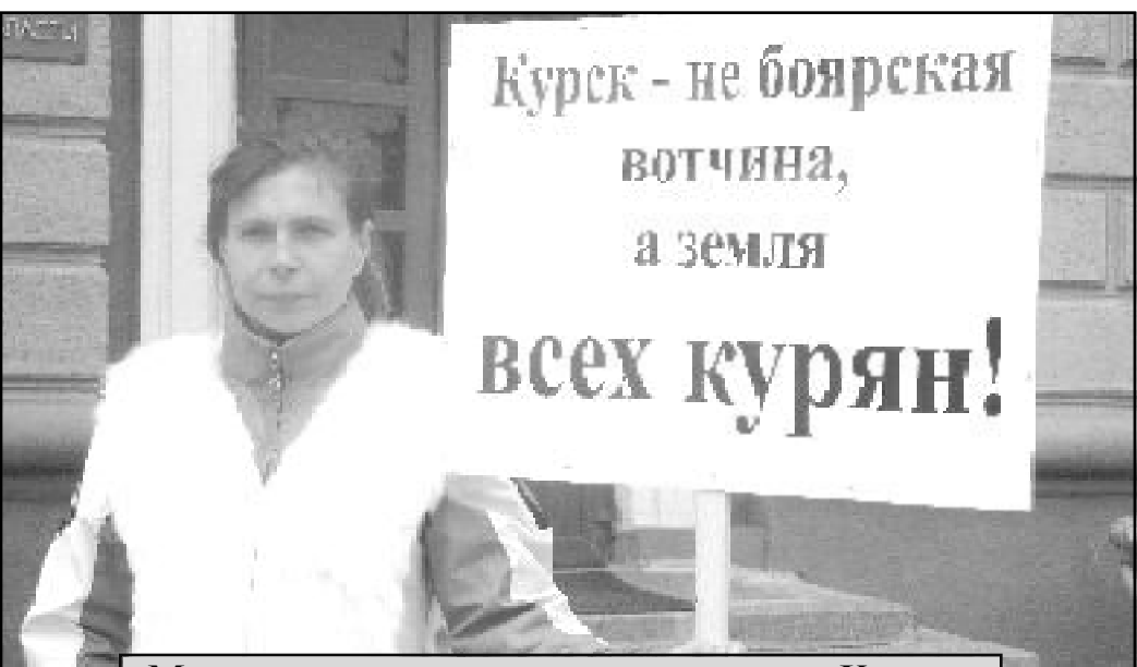
Молодые мамы у администрации г. Курска.