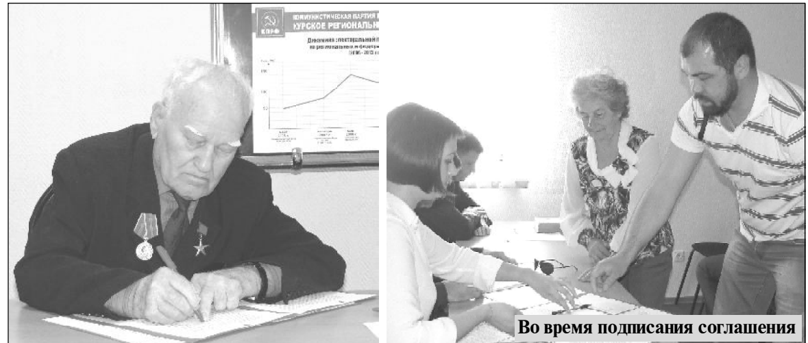
Во время подписания соглашения