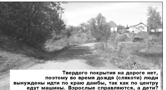
Твердого покрытия на дороге нет, поэтому во время дождя (слева) люди вынуждены идти по краю дамбы, так как по центру едут машины. Взрослые справляются, а дети?