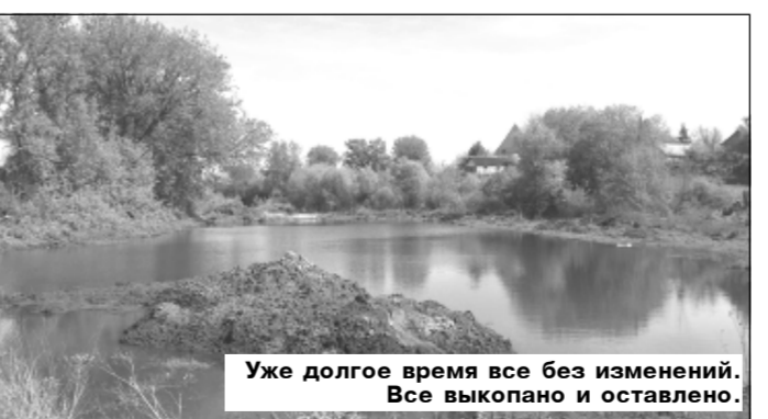
Уже долгое время все без изменений. Все выкопано и оставлено.