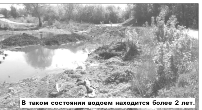
В таком состоянии водоем находится более 2 лет.