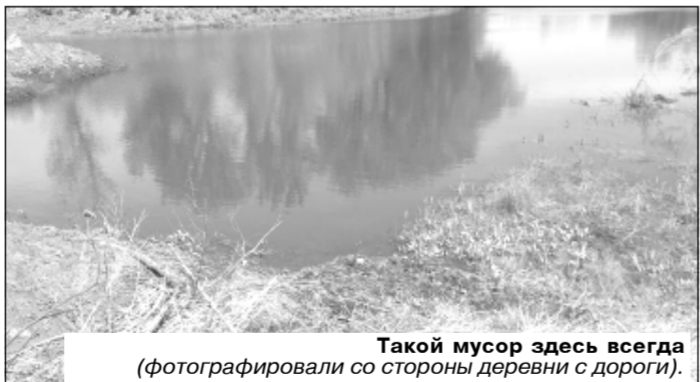
Такой мусор здесь всегда (фотографировали со стороны деревни с дороги).