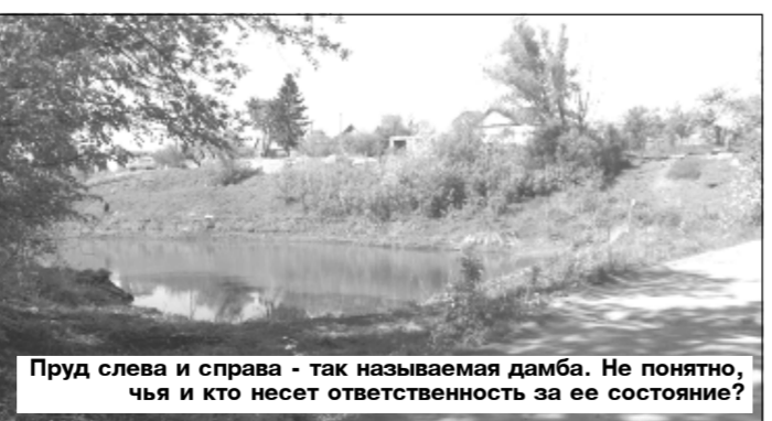
Пруд слева и справа - так называется дамба. Не понятно, чья и кто несет ответственность за ее состояние?