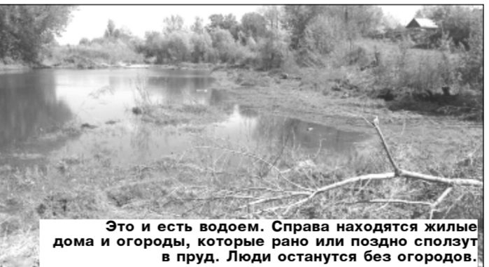
Это и есть водоем. Справа находятся жилые дома и огороды, которые рано или поздно сползут в пруд. Люди останутся без огородов.