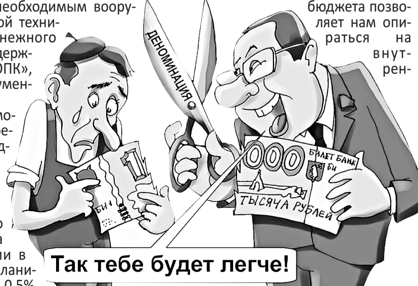
Так тебе будет легче!

Поэтому бюджет устойчив. И невысокий уровень дефицита бюджета позволяет нам опереться на внутренние ресурсы.